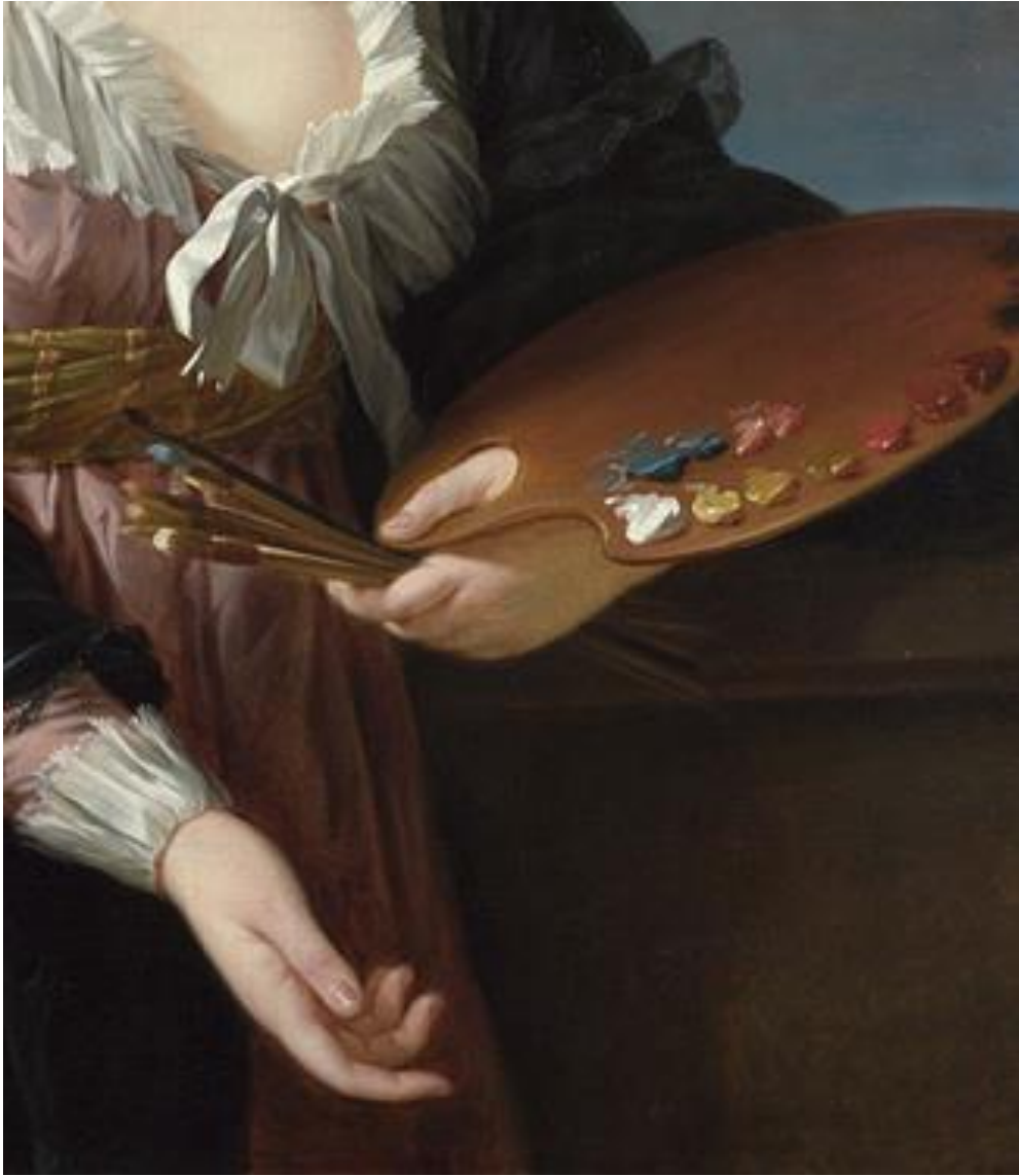
Elisabeth Louise Vigée Le Brun (1755-1852), Autoportrait au chapeau de paille , 1782, huile sur toile, 97,8 x 70,5 cm, Londres, National Gallery